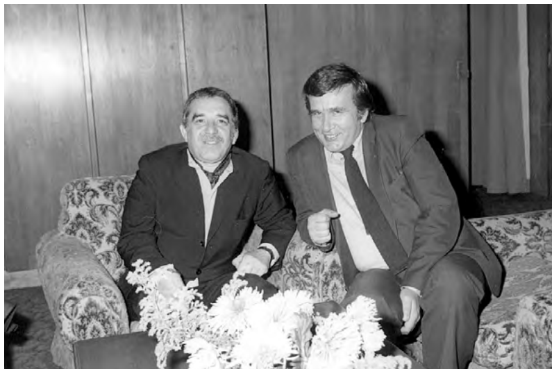
1979 г. Габриел Гарсия Маркес е в София, за да получи Международната Димитровска награда. Кучетата не се виждат.

та, когато след официалната вечеря с Габриел Гарсия Маркес Тодор Живков неочаквано се обърна към мен: