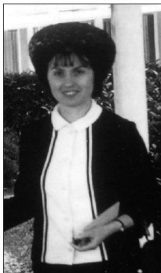
В лондонските делници с нахоканата шапка.