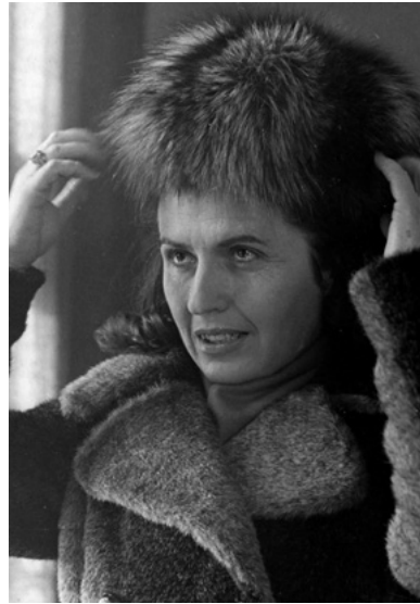
Ах, как ми стои тази кожесна шапка!

Казах му, че там шапката е едно удобство за климата на Лондон, че е нещо най-обикновено, както мъжкият каскет у нас, че и ние самите се